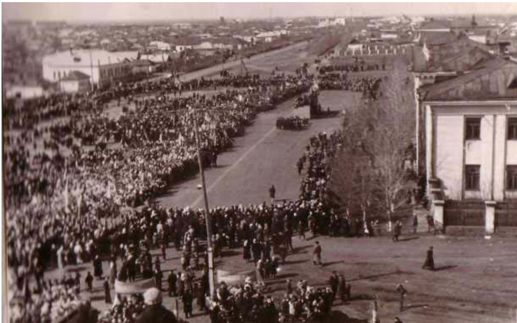
Парад на главной площади города