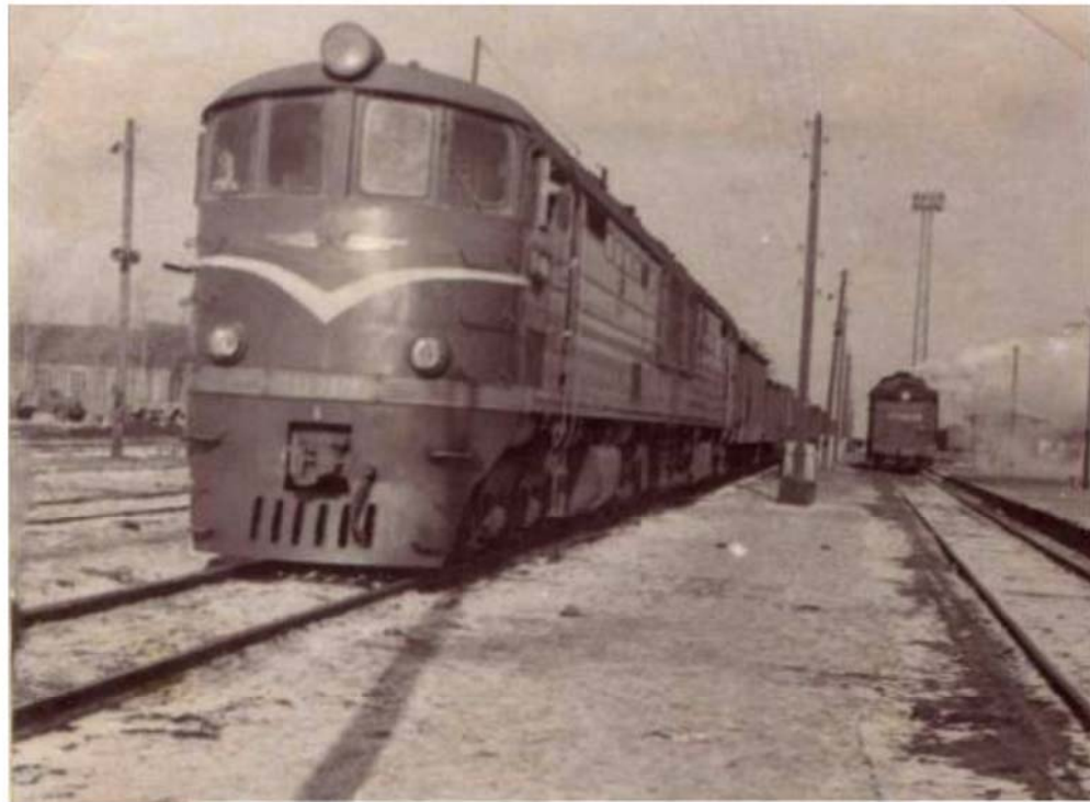
Фото разных лет