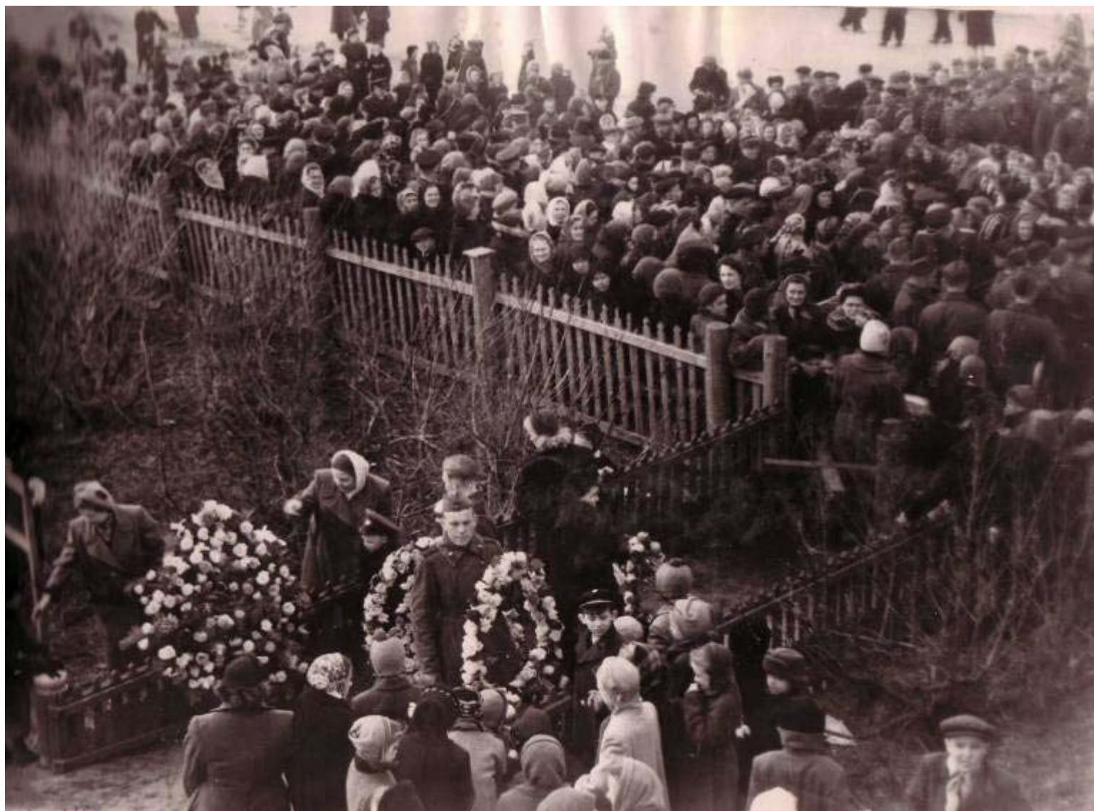
Закладка памятника жертвам контрреволюции и гражданской войны на старой площади