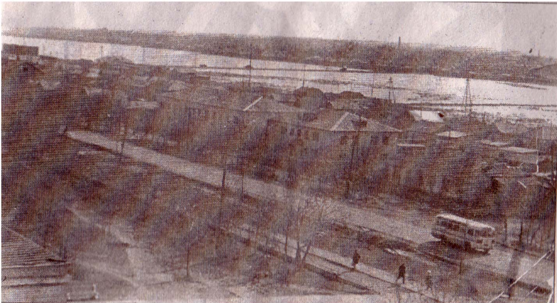
Советов – главная улица города