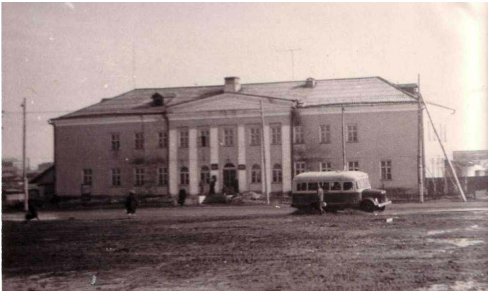
Районный узел связи на центральной площади города