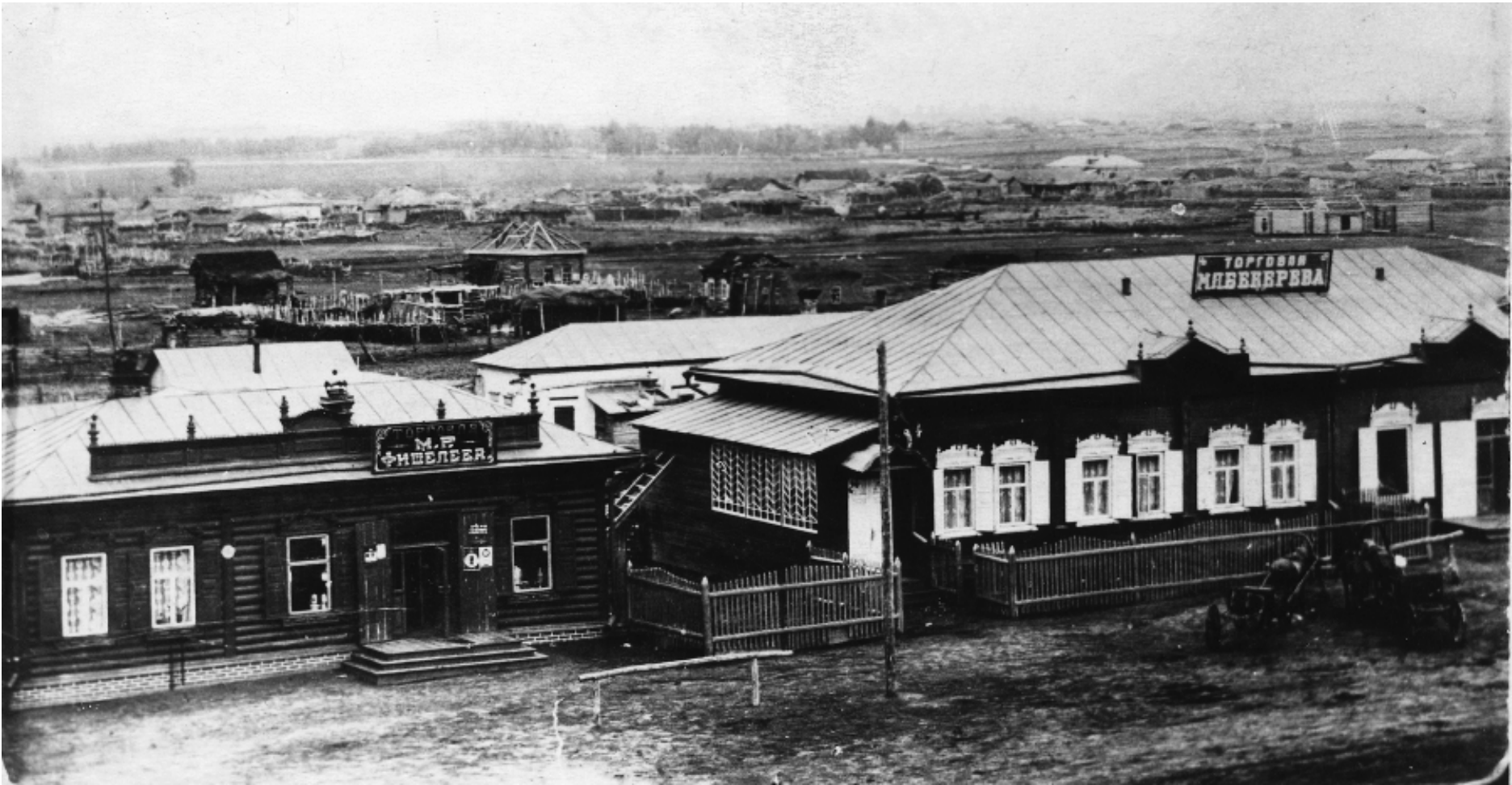
A black and white photograph of a street scene in a small town. In the foreground, there are two wooden buildings. The building on the left has a sign that reads "М.Р. ФИШЕЛСЯ". The building on the right has a sign that reads "ТОРГОВАЯ ИЛБЕВЕРВА". In the background, there are more buildings and a large open field.