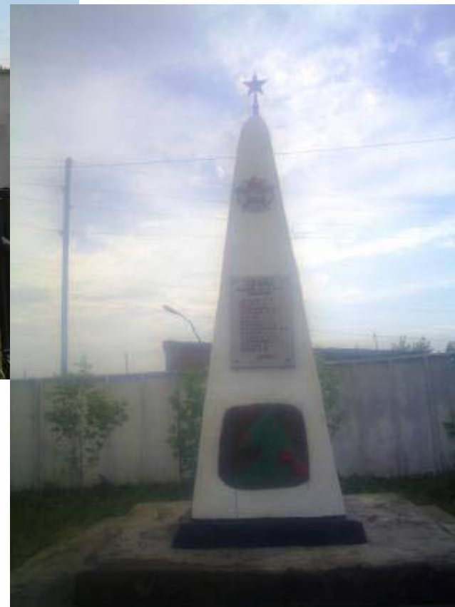
Памятник жертвам контрреволюции и гражданской войны, сооружен в 1951 году.