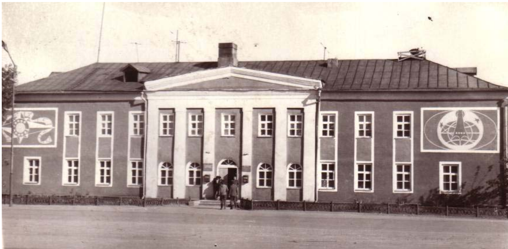
районный узел связи, построен в 1961 году