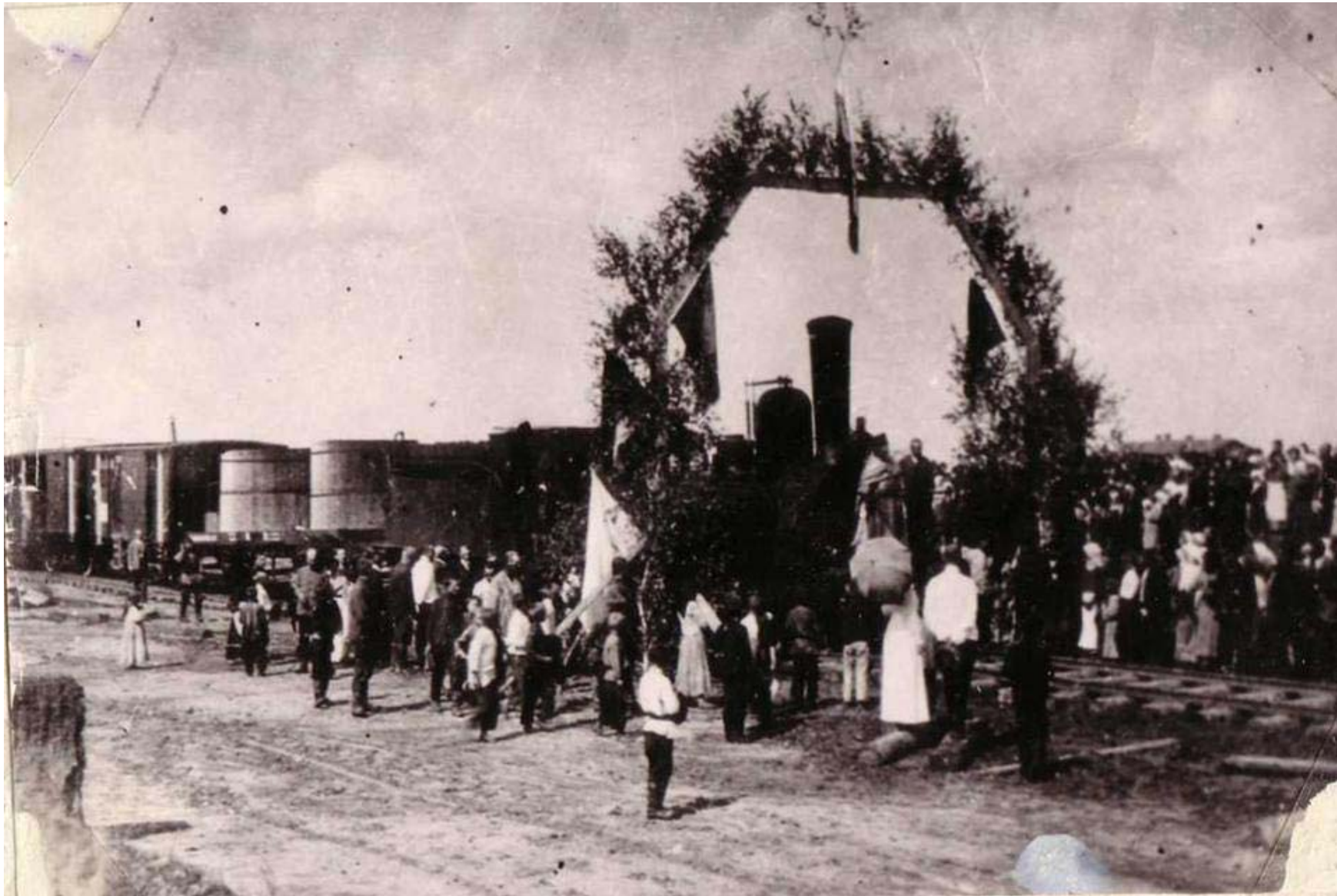
Местные жители встречают первый поезд, пришедший в Купино в августе 1915 года.