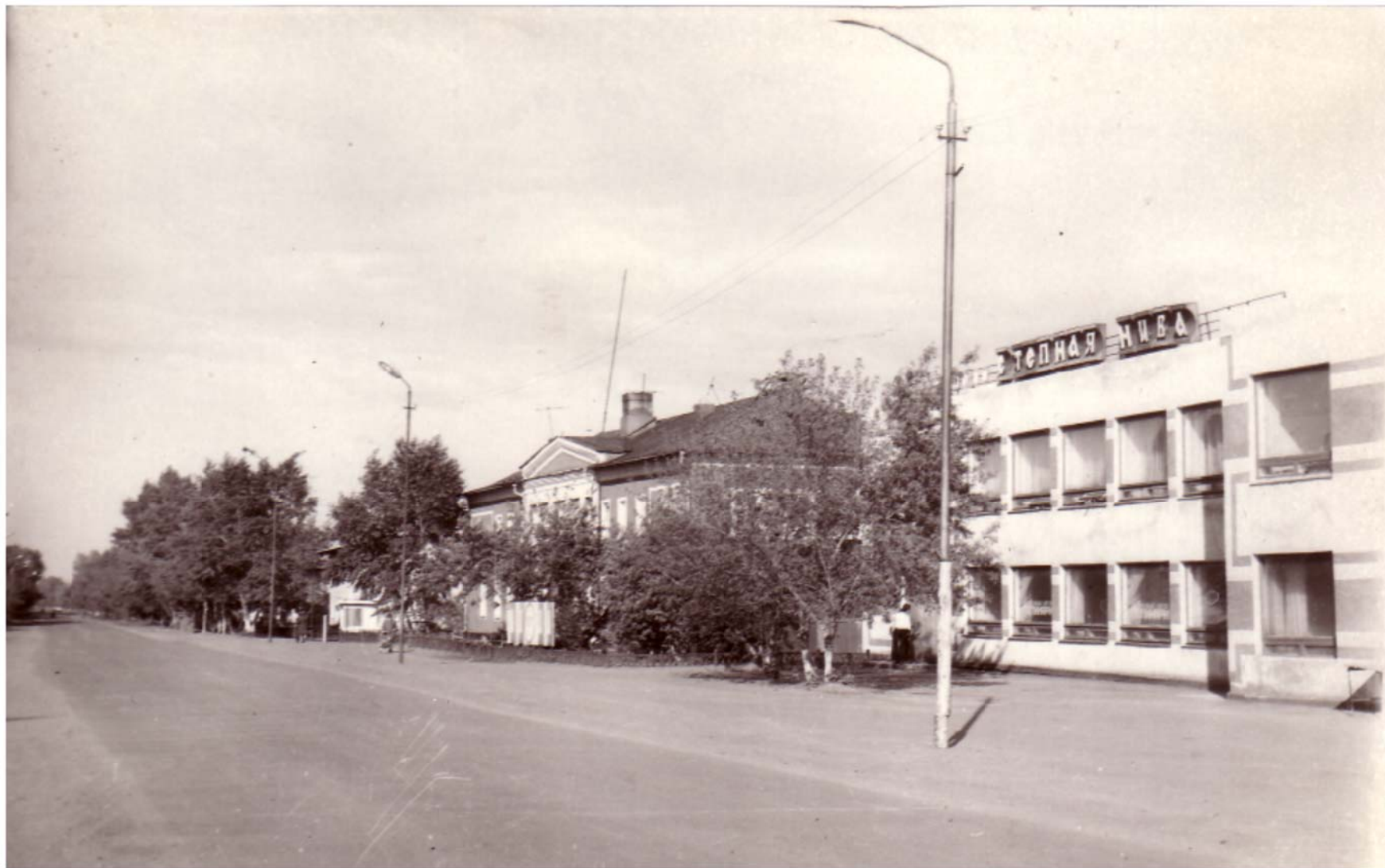
Центральная площадь города 1969 год