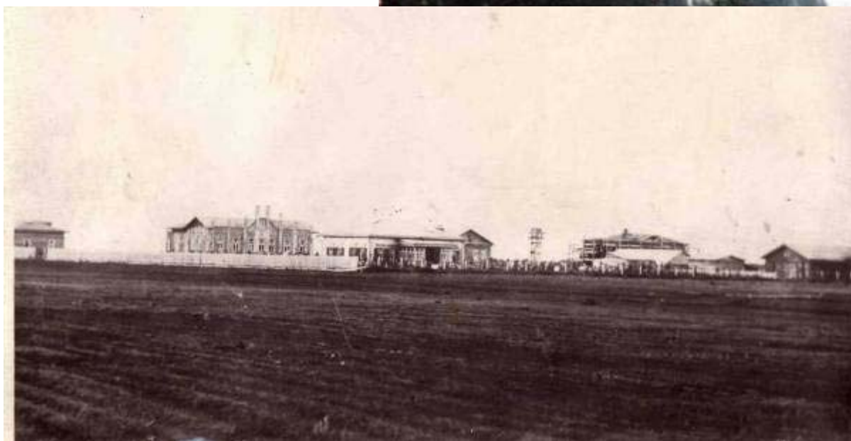
Больница Россова - архитектурный памятник города