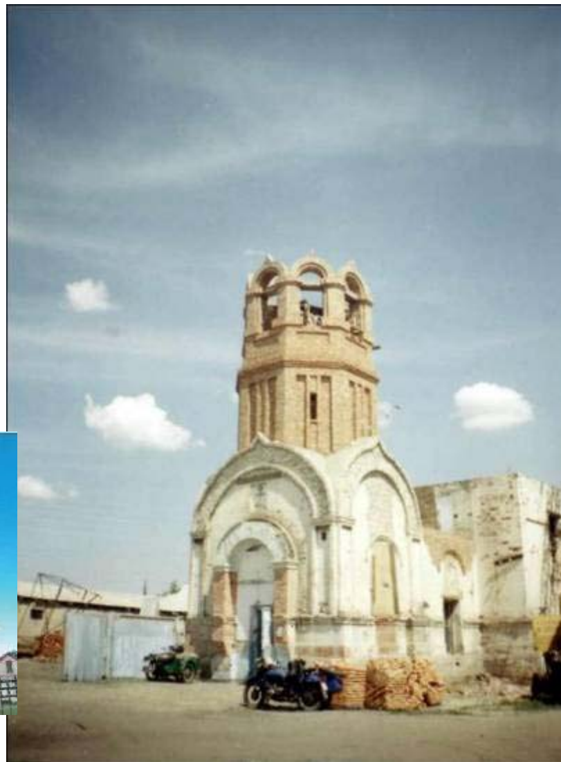
Церковь святого Луки