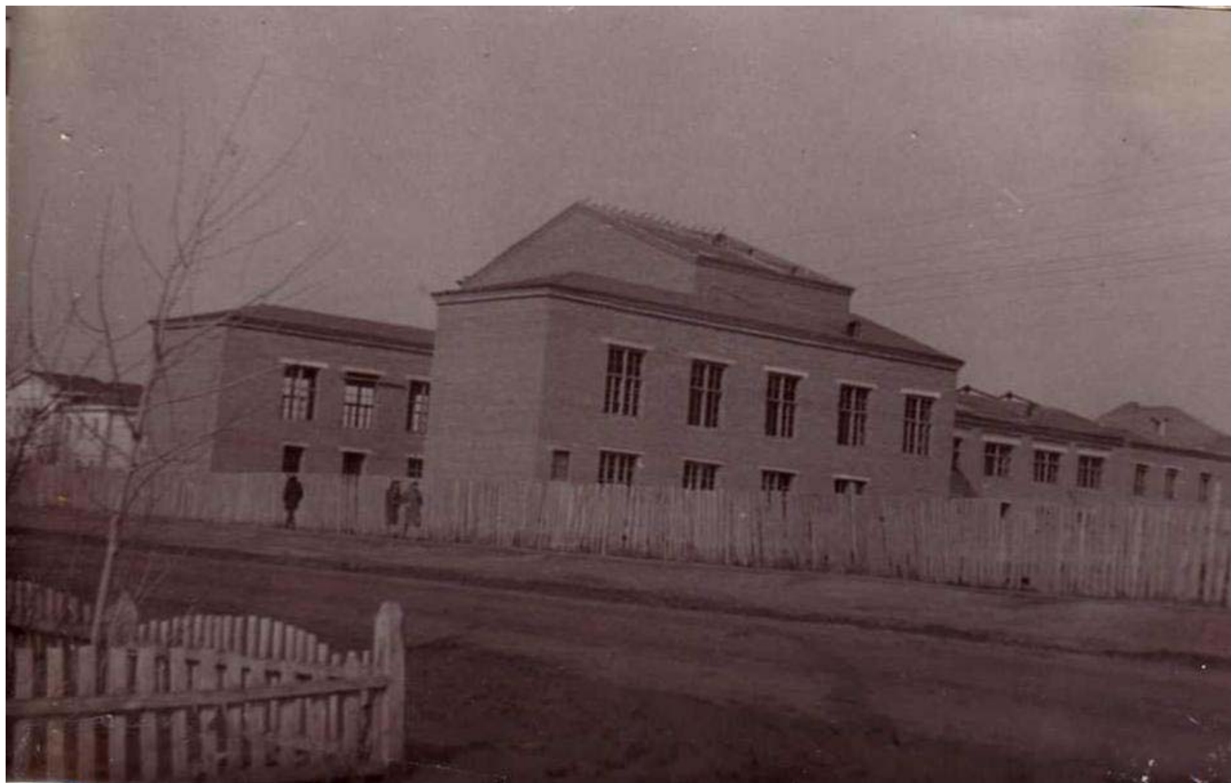
РДК им. Кирова в годы строительства здания