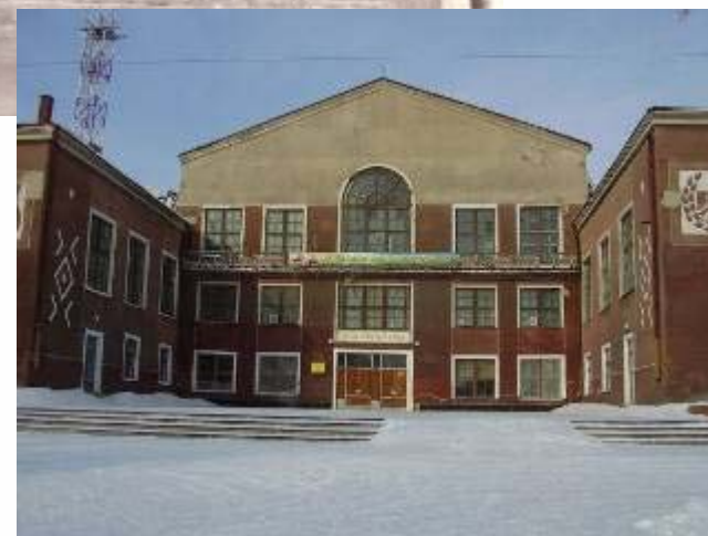
РДК им. Кирова, построен в 1965 году